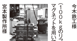
宮本製作所様 (100kgのリフティング マグネットを用いています)