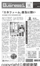
フジサンケイ ビジネスアイ

運営元である株式会社NGDの機械工具の ネット販売体制は、数々のマスコミで紹介されています