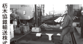
杵木協鉄輸送株式会社様 (2000kgのリフティング マグネットを用いています)