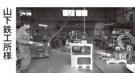
山下鉄工所様 (600kgのリフティング マグネットを用いています)