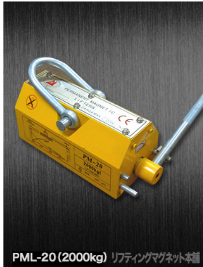
PML-20 (2000kg) リフティングマグネット本舗